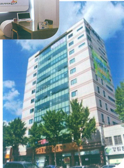
· 마산사무소_경남 창원시 마산회원구 양덕로 160