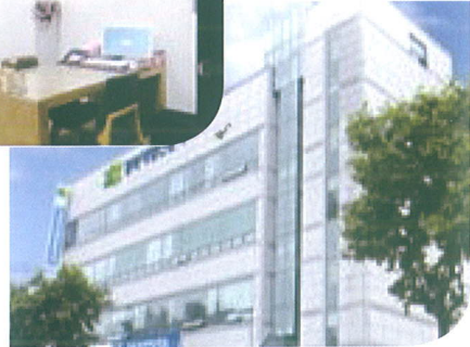
· 포항사무소_포항시 북구 용당로 66 (용흥동)